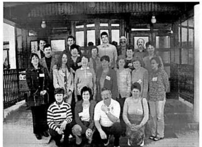
A nagydobronyi konferencia résztvevői

Miután stabilizálódott az állapota bementem a beteghez és áldott beszélgetésünk végén megkérdeztem, hogy imádkozhatok-e érte. Engedélyt adott, és én ahogyan ta-